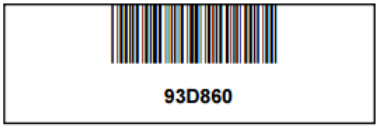
Referencia para pago