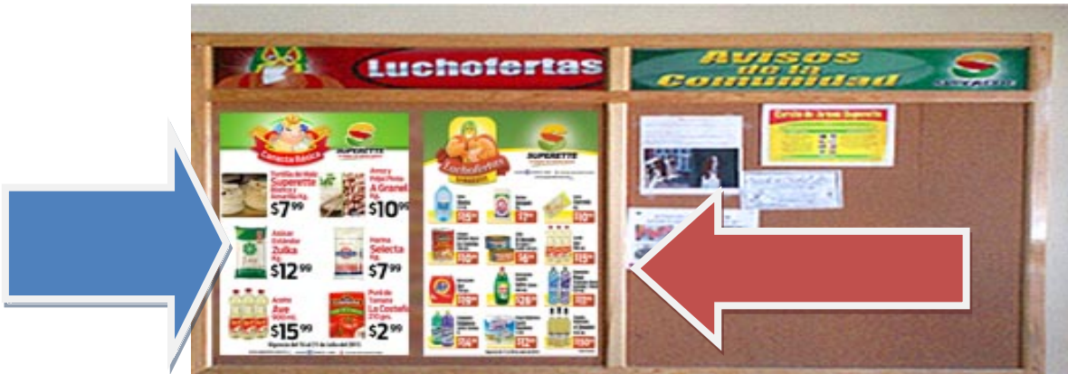
POSTER CANASTA BASICA (FLECHA AZUL) POSTER EXHIBICIONES SEMANALES (FLECHA ROJA)

Se les entregara en sucursal un Poster medida cuatro cartas el cual deberá ser colocado en el pizarrón de ofertas de la semana de cada una de sus tiendas