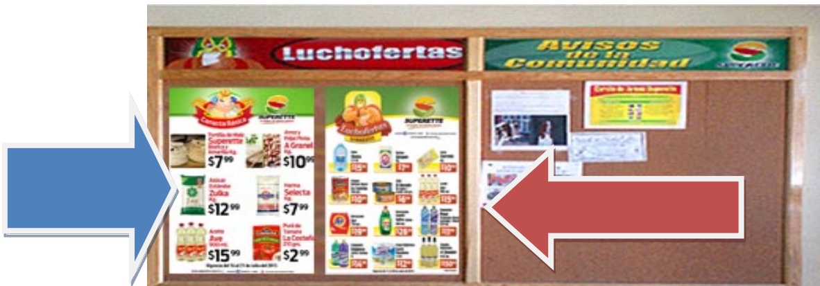
POSTER CANASTA BASICA (FLECHA AZUL) POSTER EXHIBICIONES SEMANALES (FLECHA ROJA)

Se les entregara en sucursal un Poster medida cuatro cartas el cual deberá ser colocado en el pizarrón de de ofertas de la semana de cada una de sus tiendas