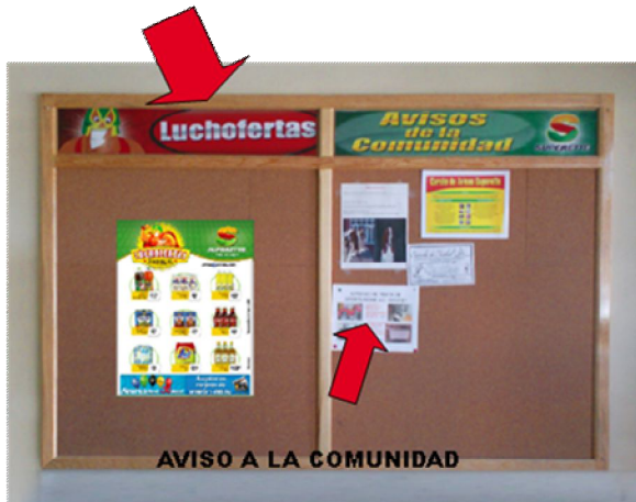
LUCHOFERTAS DE LA SEMANA