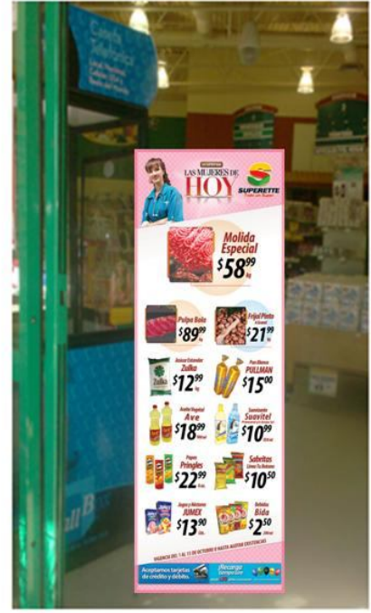
POSTER SEMANAL (LUCHOFERTAS)