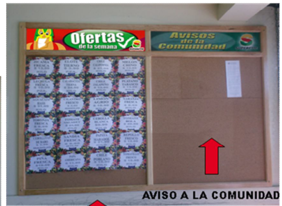
OFERTAS DE LA SEMANA