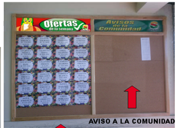
OFERTAS DE LA SEMANA