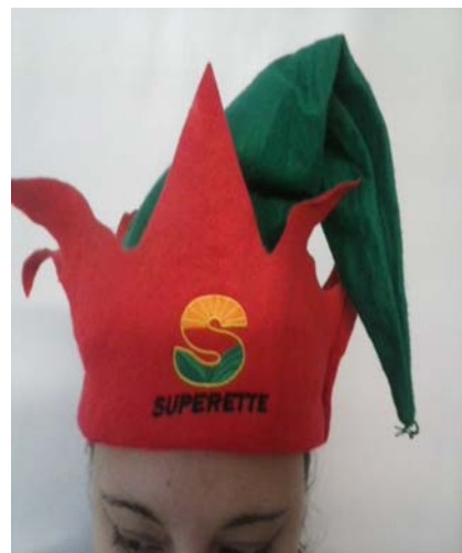
TIENDAS SUPERETTE SE LES ENVIAN 5 GORROS POR SUCURSAL

ASI MISMO QUISIERA APROVECHAR PARA PEDIR SU COLABORACION EN RETIRAR LOS MATERIALES POP CUYA VIGENCIA HAYA TERMINADO TANTO DE OFERTAS COMO IMÁGENES INSTITUCIONALES; DADO QUE SEGUIMOS VIENDO CAMPAÑAS Y OFERTAS DE MESES ANTERIORES; CON RESPECTO A LAS OFERTAS TIENEN IMPRESA SU VIGENCIA Y HABLANDO DE IMAGEN EN ESTA MISMA SECCION MEMORANDUMS USTEDES PUEDEN REVISAR CUANDO DEBE DE SER RETIRADO CADA MATERIAL