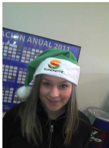
TIENDAS SUPERETTE SE LES ENVIAN 5 GORROS POR SUCURSAL

ASI MISMO QUISIERA APROVECHAR PARA PEDIR SU COLABORACION EN RETIRAR LOS MATERIALES POP CUYA VIGENCIA HAYA TERMINADO TANTO DE OFERTAS COMO IMÁGENES INSTITUCIONALES; DADO QUE SEGUIMOS VIENDO CAMPAÑAS Y OFERTAS DE MESES ANTERIORES; CON RESPECTO A LAS OFERTAS TIENEN IMPRESA SU VIGENCIA Y HABLANDO DE IMAGEN EN ESTA MISMA SECCION MEMORANDUMS USTEDES PUEDEN REVISAR CUANDO DEBE DE SER RETIRADO CADA MATERIAL