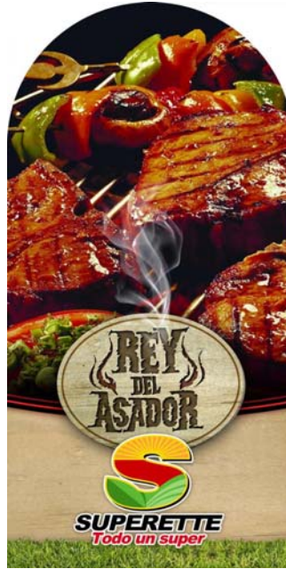
Display chico se coloco en el área de carnicería