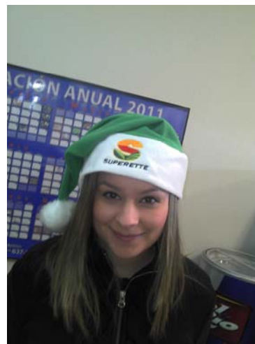
TIENDAS SUPERETTE DE LES ENVIAN 5 GORROS POR SUCURSAL

ASI MISMO QUISIERA APROVECHAR PARA PEDIR SU COLABORACION EN RETIRAR LOS MATERIALES POP CUYA VIGENCIA HAYA TERMINADO TANTO DE OFERTAS COMO IMÁGENES INSTITUCIONALES; DADO QUE SEGUIMOS VIENDO CAMPAÑAS Y OFERTAS DE MESES ANTERIORES; CON RESPECTO A LAS OFERTAS TIENEN IMPRESA SU VIGENCIA Y HABLANDO DE IMAGEN EN ESTA MISMA SECCION MEMORANDUMS USTEDES PUEDEN REVISAR CUANDO DEBE DE SER RETIRADO CADA MATERIAL