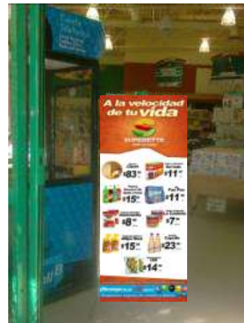
CAJAS POSTER DOBLE CARTA COLLAGE