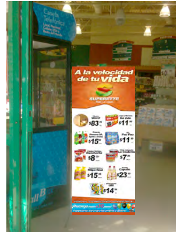
CAJAS POSTER DOBLE CARTA COLLAGE